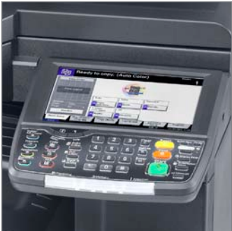
Large écran tactile couleur

Le nouveau d-Color MF2552 est équipé d'une technologie à moteur tandem qui lui confère une vitesse d'impression et de copie pouvant aller jusqu'à 25 pages A4 par minute, en couleur comme en noir et blanc. Réelle solution multifonction, le d-Color MF2552 vous permettra également de numériser en réseau vos documents à l'impressionnante vitesse de 48 originaux A4 par minute . Disponible en option, la fonction fax est également proposée afin de répondre à tous les besoins documentaires. L'ensemble des fonctions de cette solution documentaire est accessible via un large panneau de commande tactile (8,5"), intuitif et très réactif. Ainsi, réaliser un scan to e-mail ou un scan vers une clé USB devient aussi facile que de demander une simple copie recto-verso. Connectable en réseau, le d-Color MF2552 gère les fichiers PDF/A (1a et 1b) ainsi que les PDF encryptés. Le d-Color MF2552 est équipé en standard de deux magasins papier de 500 feuilles et d'un passe copie de 100 feuilles. Vous aurez donc la possibilité de disposer de trois types de supports papier différents en poste. Afin d'apporter une finition résolument professionnelle à vos documents, vous pourrez équiper votre d-Color MF2552 d'un module de finition optionnel qui vous permettra d'agrafer vos copies et vos impressions.