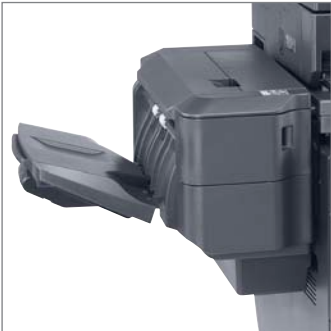
Finisseur agrafeur optionnel (500 feuilles)