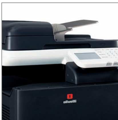
CHARGEUR RECTO/VERSO 50 feuilles