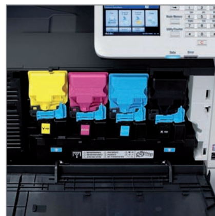
COUTS COPIES REDUITS ET REMPLACEMENT FACILE DES CONSOMMABLES