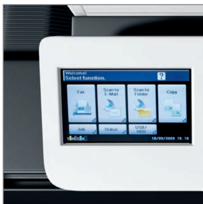
ECRAN D'OPERATIONS TACTILE